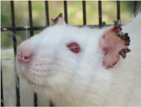
Рис. 1. Кірки на шкірі вушних раковин щура.

Описання клінічного випадку. Анамнез. Щур, самець, кличка «Е...», вік – 2 роки, маса тіла 300 г. Утримувався у відділі кормових тварин КО «Харківський зоологічний парк». Зі слів робітників відділу у тварини візуалізували коричневого кольору кірки на краях вушних раковин, спостерігався свербіж, тварина була пригнічена, погано приймала корм, частіше сиділа забившись у куток клітки. У клініку кафедри паразитології ХДЗВА тварина поступила 30.03.2016 року.