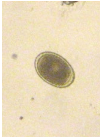
Рис. 4. Яйце нематоди виду Paraspidodera uncinata (×620).