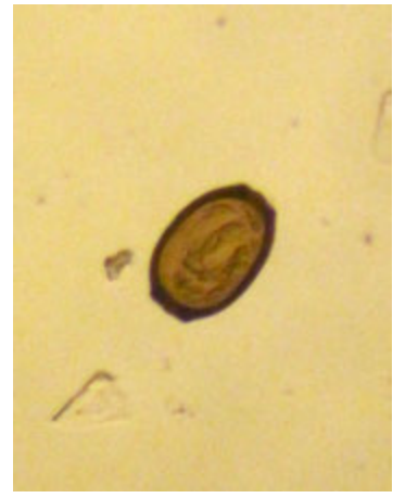
Рис. 5. Яйце нематоди виду Trichosomoides crassicauda (×780).

Ідентифікацію виявлених овоскопічних елементів проводили за допомогою атласу Thienpont D., Rochette F. та Vanparijs O.F.J. (1979) [3]. Встановлено, що яйця зображені на рис. 3 належать цестоді виду Hymenolepis diminuta (Rudolphi, 1819; Blanchard, 1891) з родини Hymenolepididae , ряду Cyclophyllidea (ціп'яки), на рис. 4 – нематоді виду Paraspidodera uncinata (Rudolphi, 1819) з родини Heterakidae , а бочкоподібні яйця на рис. 5 належать нематоді виду Trichosomoides crassicauda (Hall, 1916) з родини Trichuridae .